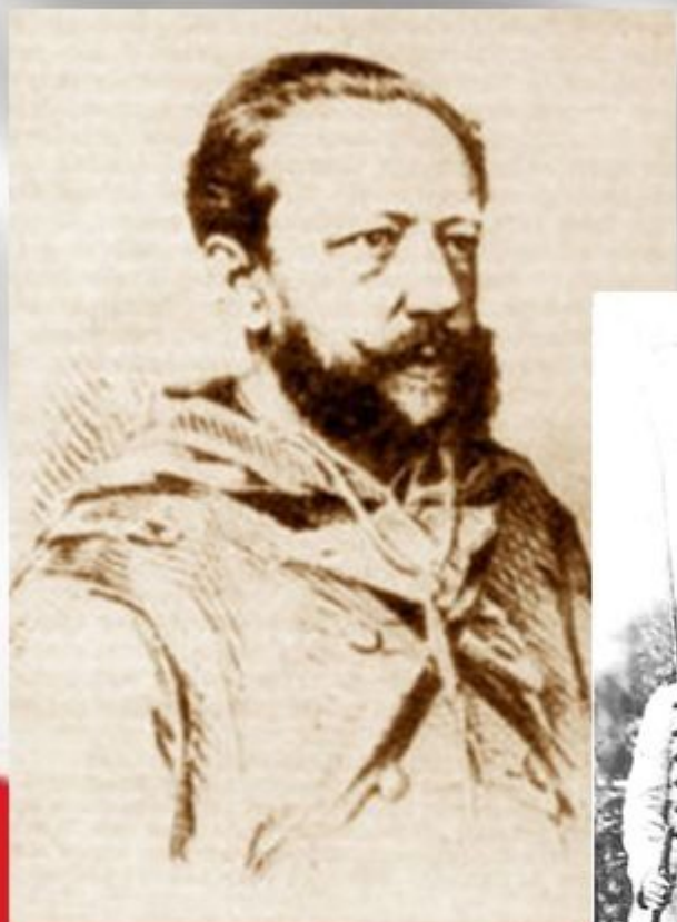
gen. Józef Hauke-Bossak