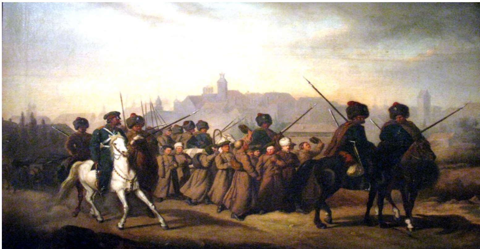
„Branka Polaków do armii rosyjskiej w 1863 roku”

Wśród bezpośrednich przyczyn wybuchu powstania wymienia się brankę ogłoszoną na terenie Królestwa Polskiego. Sprzeciw wobec branki był ochroną kadr do walki czy sprzeciwu przeciwko Rosji. Z tego powodu podjęto decyzję o wybuchu powstania w styczniu, najmniej korzystnym miesiącu dla walki. W śnieg i mróz młodzi chłopcy pakowali swoje rzeczy i szli uciekać przed poborem. Nie zawsze wiedzieli, gdzie idą. Chronili się w Puszczy Kampinoskiej, gdyż była ona najbliżej Warszawy.