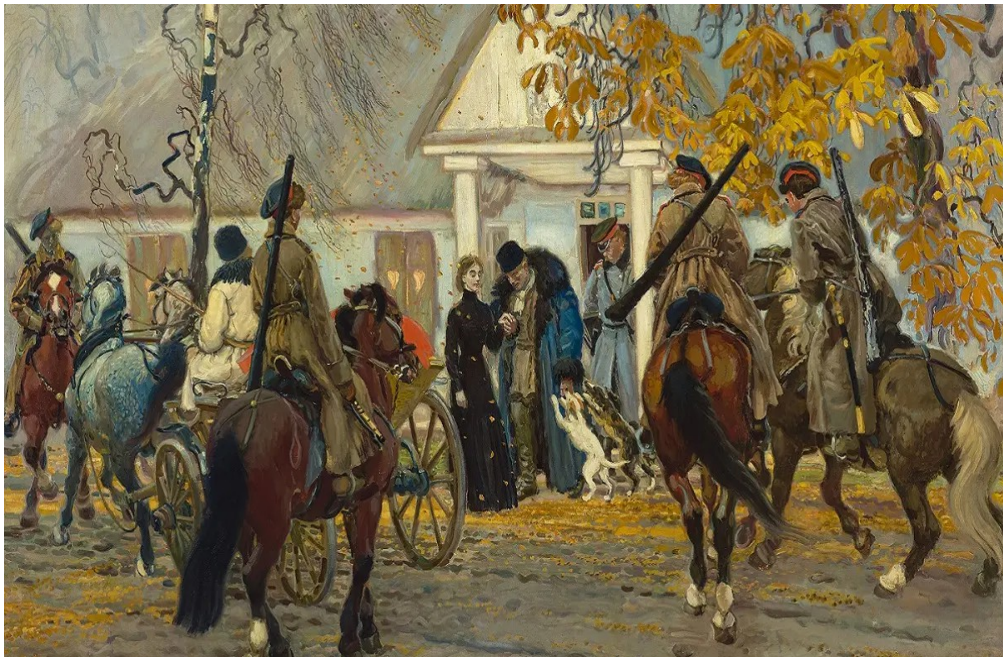
Stanisław Masłowski, Aresztowanie powstańca, 1910, Muzeum Narodowe w Warszawie